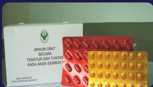
Bentuk Obat TB